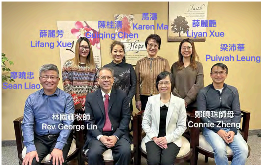
2025 柬埔寨短宣隊員合照

感謝天父的恩典，麥浸國語堂和粵語堂的八位弟兄姐妹有幸參與2025年1月8日至22日的柬埔寨短宣事工。從報名、預備到出發，過程中雖經歷了一些突發變動，但天父的信實與大能使所有問題都及時得到圓滿解決，短宣隊得以按時順利出發。